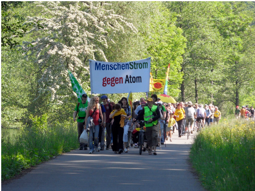
Menschenstrom gegen Atom 24.Mai 2010 (F.C.)