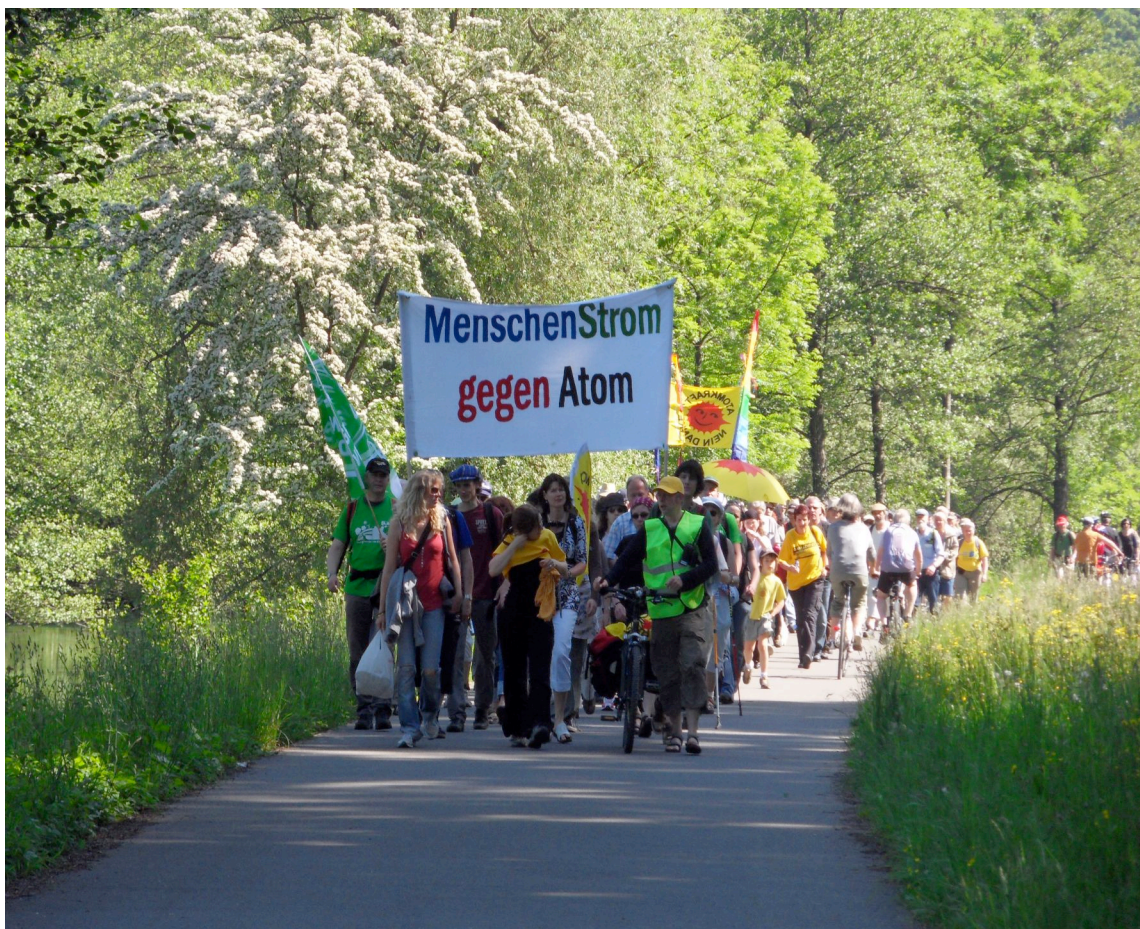
Sortons du nucléaire 24 mai 2010 (F.C.)