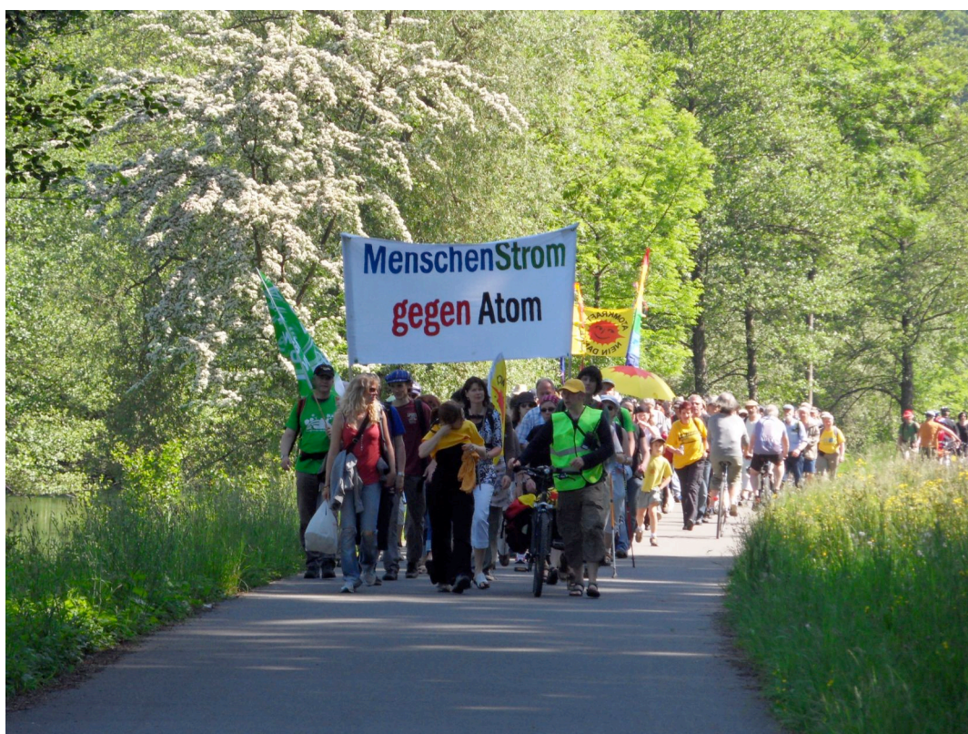
Corrente umana contro l'atomo 24.5.10 (F.C.)